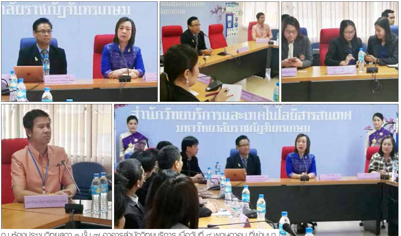
ณ ห้องประชุมวิทยสภา ๑ ชั้น ๗ อาคารสำนักวิทยบริการ เมื่อวันที่ ๔ พฤษภาคม ที่ผ่านมา