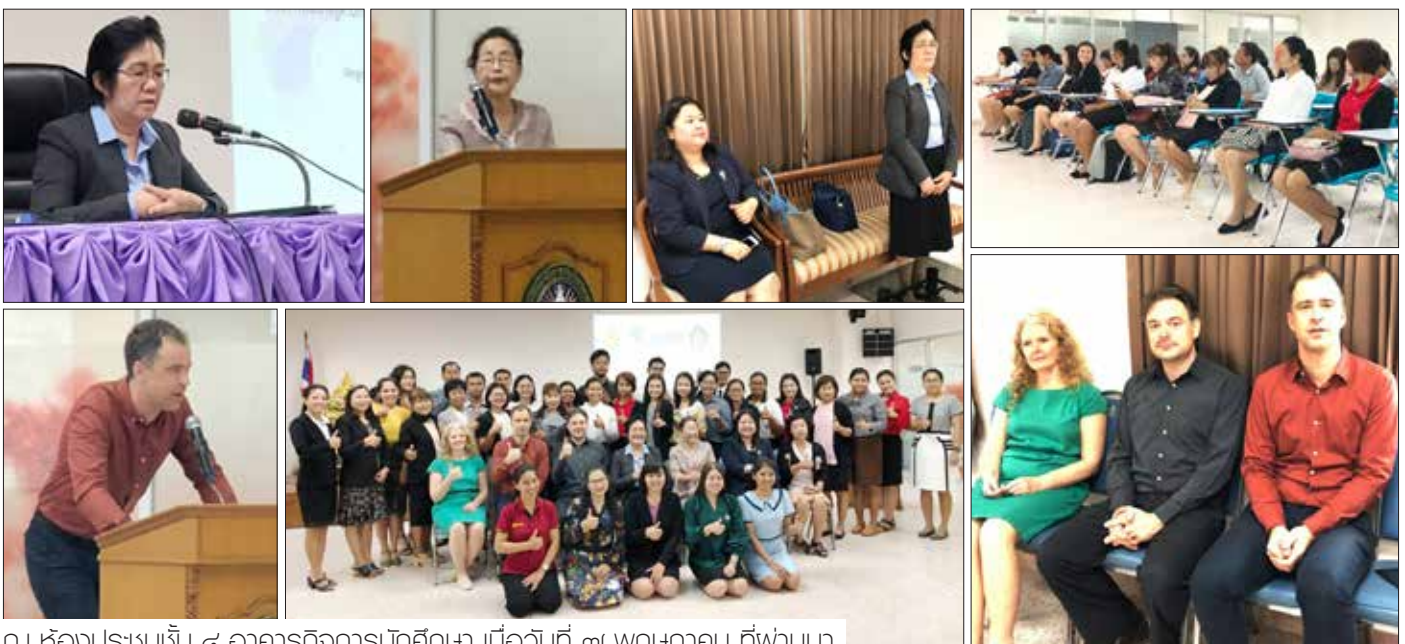
ณ ห้องประชุมชั้น ๔ อาคารกิจการนักศึกษา เมื่อวันที่ ๗ พฤษภาคม ที่พวนมา