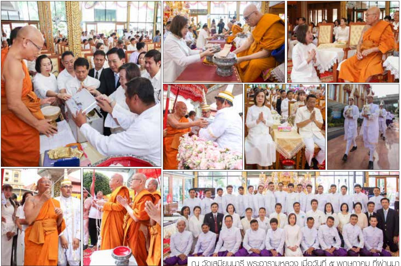
ณ วัดเสถียมนารี พระอารามหลวง เมื่อวันที่ ๕ พฤษภาคม ที่พวนมา