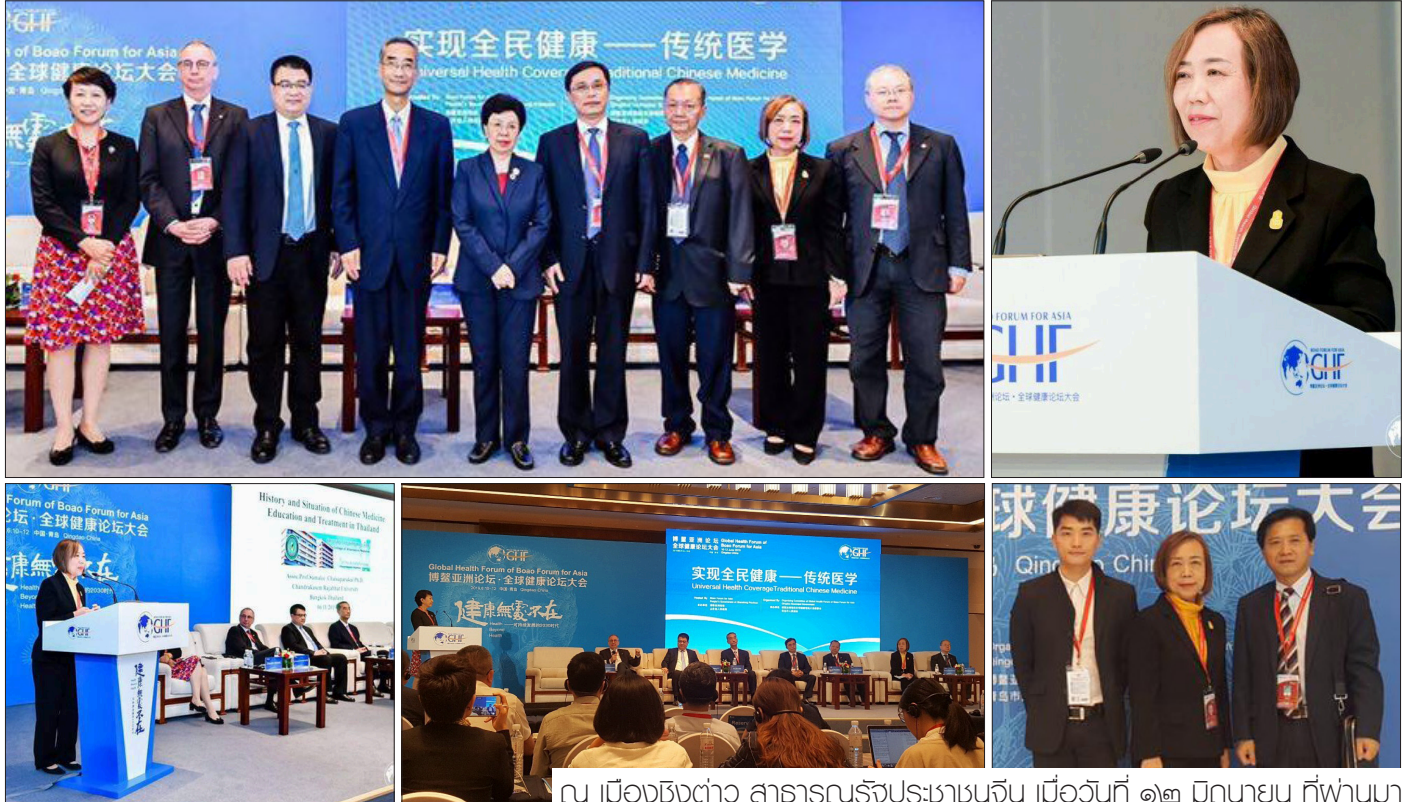
ณ เมืองชิงเต่า สาธารณรัฐประชาชนจีน เมื่อวันที่ ๑๓ มิถุนายน ที่ผ่านมา