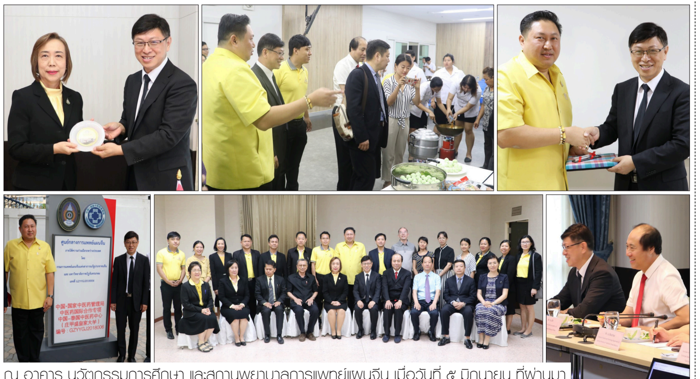
ณ อาคาร นวัตกรรมการศึกษา และสถานพยาบาลการแพทย์แผนจีน เมื่อวันที่ ๕ มิถุนายน ที่ผ่านมา