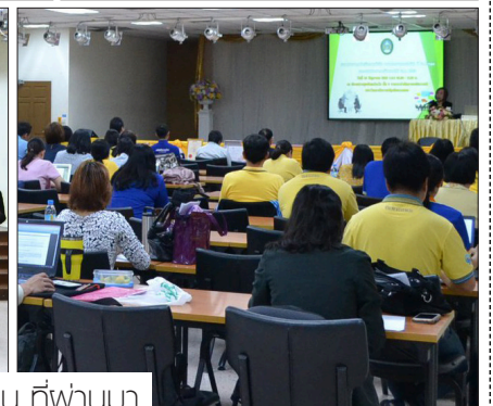
ณ ห้องประชุมจันทรจรัส ชั้น ๓ อาคารสำนักงานอธิการบดี เมื่อวันที่ ๒๘ มิถุนายน ที่ผ่านมา