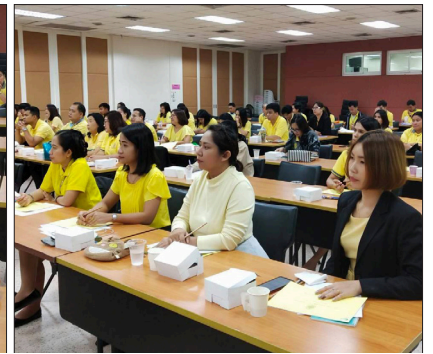
ณ ห้องประชุมจันทรประภัสร์ ชั้น ๕ อาคารสำนักงานอธิการบดี เมื่อวันที่ ๒๗ มิถุนายน ที่ผ่านมา