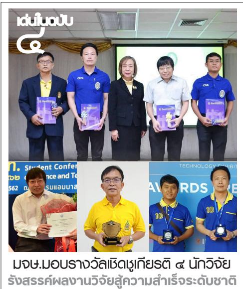
มจร.มอบรางวัลเชิดชูเกียรติ ๔ นักวิจัย รังสรรค์ผลงานวิจัยสู่ความสำเร็จระดับชาติ

“โครงการอบรมผู้นำครั้งนี้ สิ่งทีผู้นำนักศึกษาทุกคนได้รับ คือ ทักษะความเป็นผู้นำผู้ตาม ทั้งด้านการแสดงออก วิถีผู้นำรุ่นใหม่นำไปปรับใช้ในการทำกิจกรรม เช่น การเขียนโครงการ การกำหนดวัตถุประสงค์และตัวชี้วัดให้สอดคล้องกับเป้าหมาย รวมถึงนักศึกษาที่เป็นผู้นำสาขา ยังมาประยุกต์ใช้ในกิจกรรมรับน้องฯ ในปีการศึกษา ๒๕๖๒ นี้ ให้เป็นไปตามกรอบนโยบายที่ กระทรวงการอุดมศึกษา วิทยาศาสตร์ วิจัยและนวัตกรรม และมหาวิทยาลัยกำหนดได้อย่างถูกต้อง”