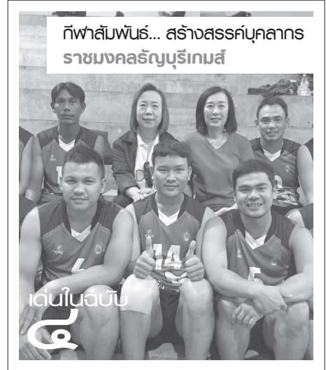
กีฬาสัมพันธ์... สร้างสรรค์บุคลากร ราชชมงคลธัญบุรีเกษมส์

“การปลูกต้นกล้ามหาลักษณ์ - สักสยามินทร์ ได้ใช้พื้นที่ของศูนย์การศึกษามหาวิทยาลัยราชภัฏจันทรเกษม - ชัยนาท ประมาณ ๑ ไร่ โดยการ