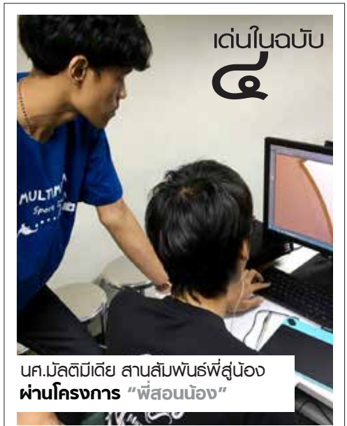
นศ.บัลติมิตี๋ย สานสัมพันธ์ที่สู่น้อง ผ่านโครงการ “พี่สอนน้อง”

“โครงการนี้ ใกล้เสร็จสิ้นลงแล้ว ทางสาขาฯ จึงสานต่อโครงการในเทอมต่อไป โดยจะนำนักศึกษาในรายวิชาต่าง ๆ ทางด้านดนตรี ร่วมถ่ายทอดความรู้ เพราะการเรียนทฤษฎีและปฏิบัติแต่ภายในมหาวิทยาลัยไม่เพียงพอ ต้องนำไปถ่ายทอดสู่สังคมด้วย” ประธานสาขาฯ กล่าว