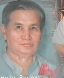
มจรจ. จันทรเกษม

มหาวิทยาลัยราชภัฏจันทรเกษม CHANDRAKASEM RAJABHAT UNIVERSITY