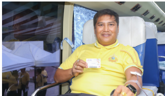
เฉลิมพระเกียรติฯ