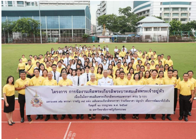
โครงการ การจัดงานเทิดพระเกียรติพระบาทสมเด็จพระเจ้าอยู่หัว เนื่องในโอกาสเฉลิมพระเกียรติพระชนมพรรษา ครบ ๖ รอบ มหามงคล ๗๐ พรรษา วรภัย ๗๘ แห่ง เฉลิมพระเกียรติพระราชินี ร่วมจิตอาสา ปลูกป่า เพื่อการพัฒนาที่ยั่งยืน วันที่ ๑๐ กรกฎาคม พ.ศ. ๒๕๖๗ ณ มหาวิทยาลัยราชภัฏจันทรเกษม

มหาวิทยาลัยราชภัฏจันทรเกษม จัดพิธีถวายพระพรชัยมงคล พระบาทสมเด็จพระปรเมนทรรามาธิบดีศรีสินทรมหาวชิราลงกรณ พระวชิรเกล้าเจ้าอยู่หัว เนื่องในโอกาสวันเฉลิมพระชนมพรรษา ๖ รอบ ๓๒ พรรษา โดยมีพิธีถวายพระพรชัยมงคล, กิจกรรมเทิดพระเกียรติ ราชภัฏ ๓๘ แห่ง ร่วมจิตอาสา ปลูกป่า เพื่อการพัฒนาที่ยั่งยืน และกิจกรรมบริจาคโลหิต ด้วยหัวใจ ณ มรท.จันทรเกษม และจังหวัดชัยนาท เมื่อเร็ว ๆ นี้