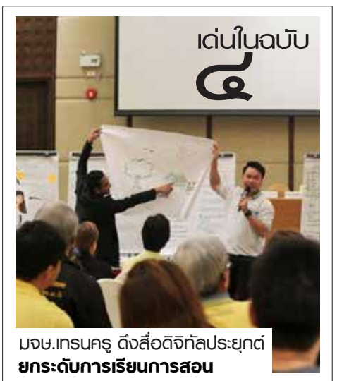
มจร.เศรษฐฯ ดึงสื่อดิจิทัลประยุกต์ยกระดับการเรียนการสอน

จากผู้เข้าร่วมมีความสนใจในหัวข้อนี้มาก เพราะว่าการประชาสัมพันธ์งานเพียงไม่กี่วัน แต่ผู้เข้าร่วมได้ให้ความสนใจในเรื่องของตลาดในการลงทุนในประเทศกัมพูชา