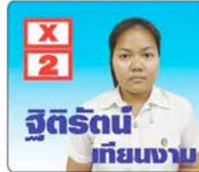
เลือกตั้งล่วงหน้า 4-13 มีนาคม 2563 เวลา 9.00-15.00 น. ณ ห้องสำนักงานของพัฒนาการศึกษา