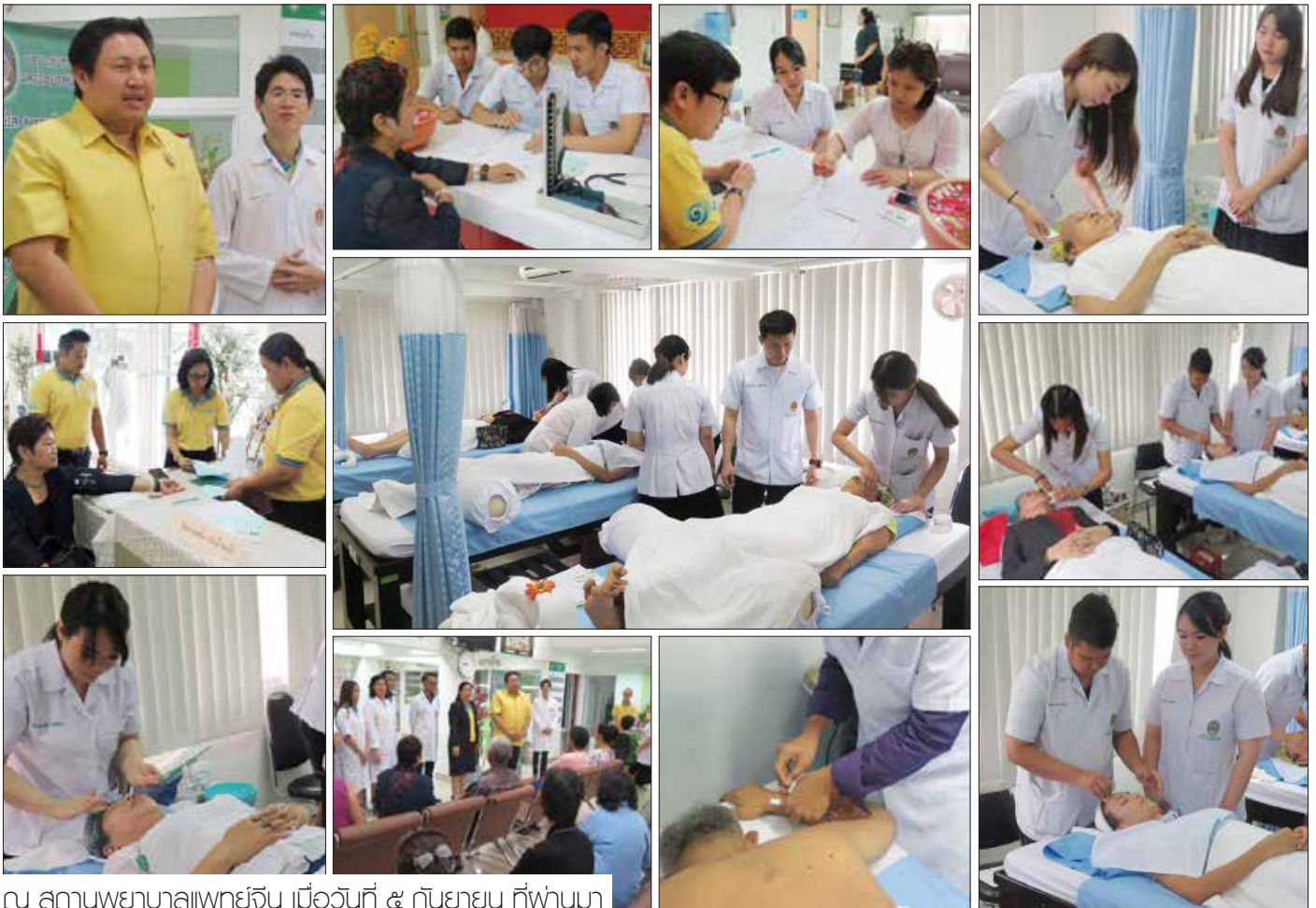
ณ สถานพยาบาลแพทย์จีน เมื่อวันที่ ๕ กันยายน ที่ผ่านมา