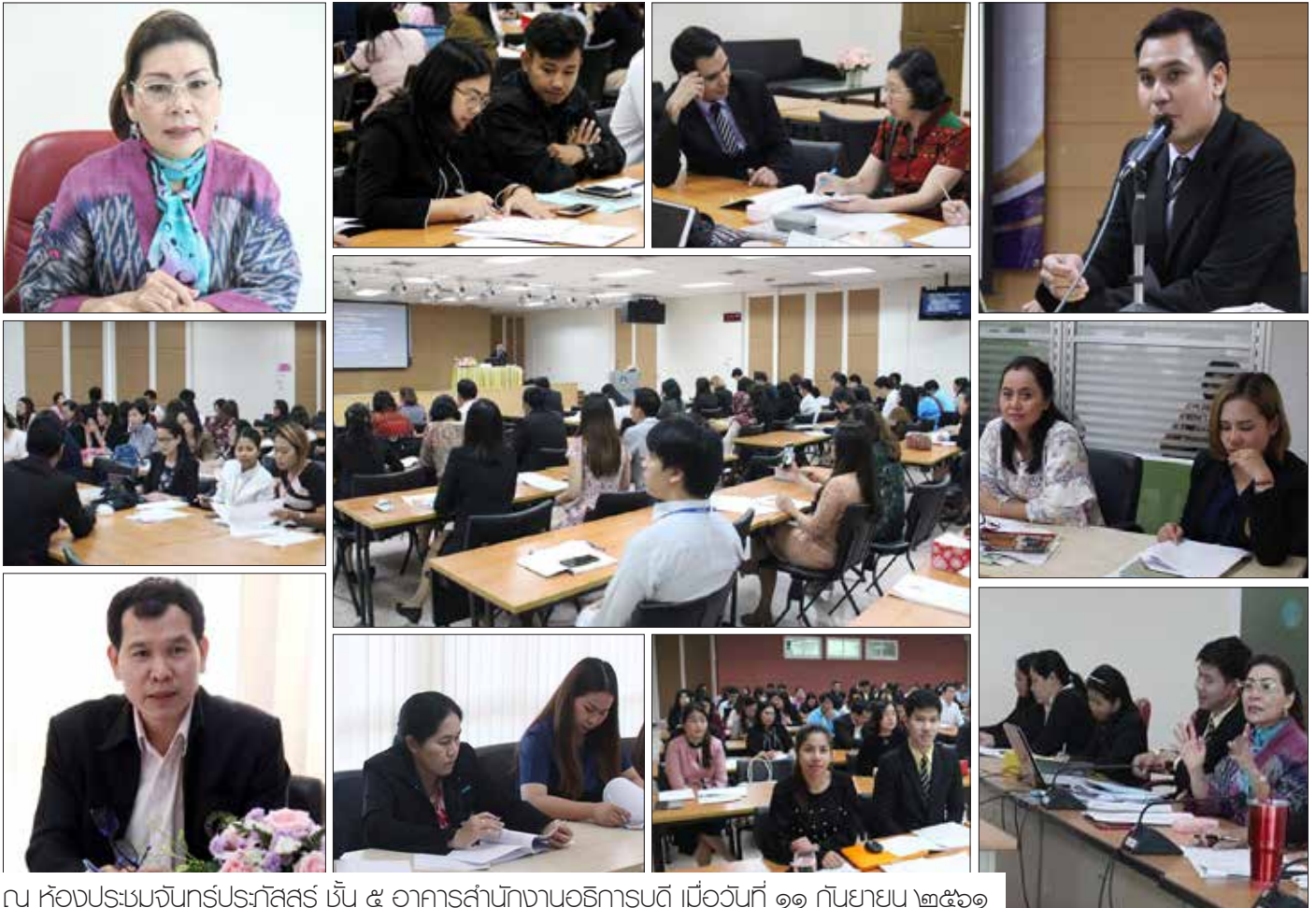
ณ ห้องประชุมจันทร์ประภัสสร ชั้น ๕ อาคารสำนักงานอธิการบดี เมื่อวันที่ ๑๑ กันยายน ๒๕๖๑