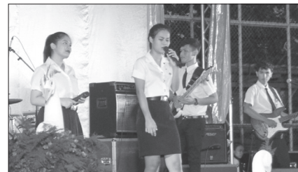
ณ สนามกีฬาในร่ม เมื่อวันที่ ๒๑ กันยายนที่ผ่านมา