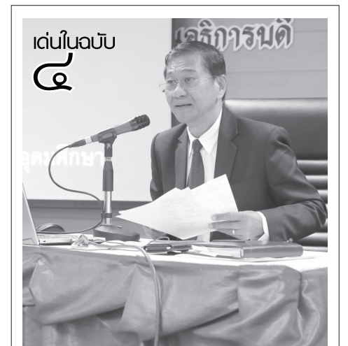
เด่นในฉบับ ๔

อาจารย์พิชิต กล่าวเพิ่มเติมว่า อ่านต่อหน้า ๖