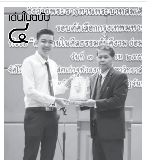
“อ้อด” ...เด็กหนุ่มหัวใจรักไทย สืบสานความเป็นไทยผ่านเวทีการประกวดระดับชาติ

แพทย์แผนจีน และร่วมฉลองครบรอบ ๗๖ ปี วันสถาปนามหาวิทยาลัย