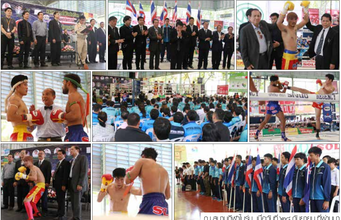
ณ สนามกีฬาในร่ม เมื่อวันที่ ๒๘ กันยายน ที่ผ่านมา