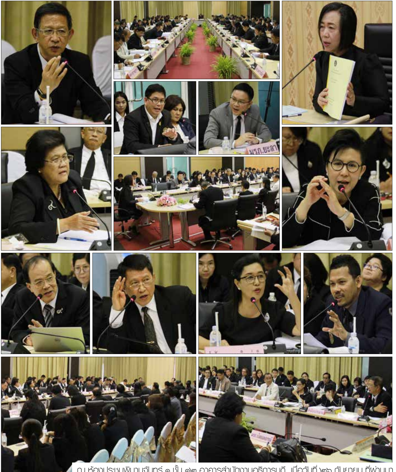
ณ ห้องประชุมพิฆานจันทร์ ๑ ชั้น ๑๒ อาคารสำนักงานอธิการบดี เมื่อวันที่ ๓๖ กันยายน ที่ผ่านมา