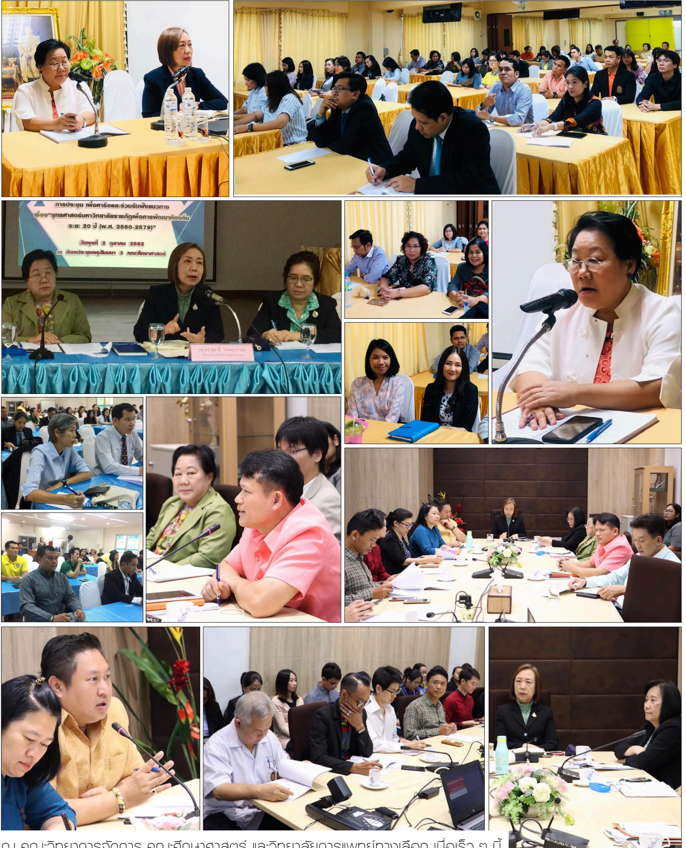
ณ คณะวิทยาการจัดการ คณะศึกษาศาสตร์ และวิทยาลัยการแพทย์ทางเลือก เมื่อเร็ว ๆ นี้