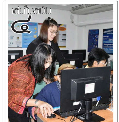
วอจ.เดินหน้าขับเคลื่อนพัฒนาท้องถิ่น เสริมสร้างการเรียนรู้ตลอดชีวิตแก่ผู้สูงวัย

เอกสารรับรองจากองค์กรดังที่ได้กล่าวมาแล้ว ในข้อ ๒ สามารถนำไปใช้เป็นหลักฐานในการสมัครงานและการรับรองดังกล่าวยังมีทำให้ความรู้และทดสอบให้ครอบคลุมมาตรฐานที่ทางสำนักงาน กพ. ได้ประกาศไว้อีกด้วยแน่นอนว่าเป็นประโยชน์อย่างยิ่งในการยื่นสมัครงานในตำแหน่งต่าง ๆ” ผู้อำนวยการฯ กล่าว