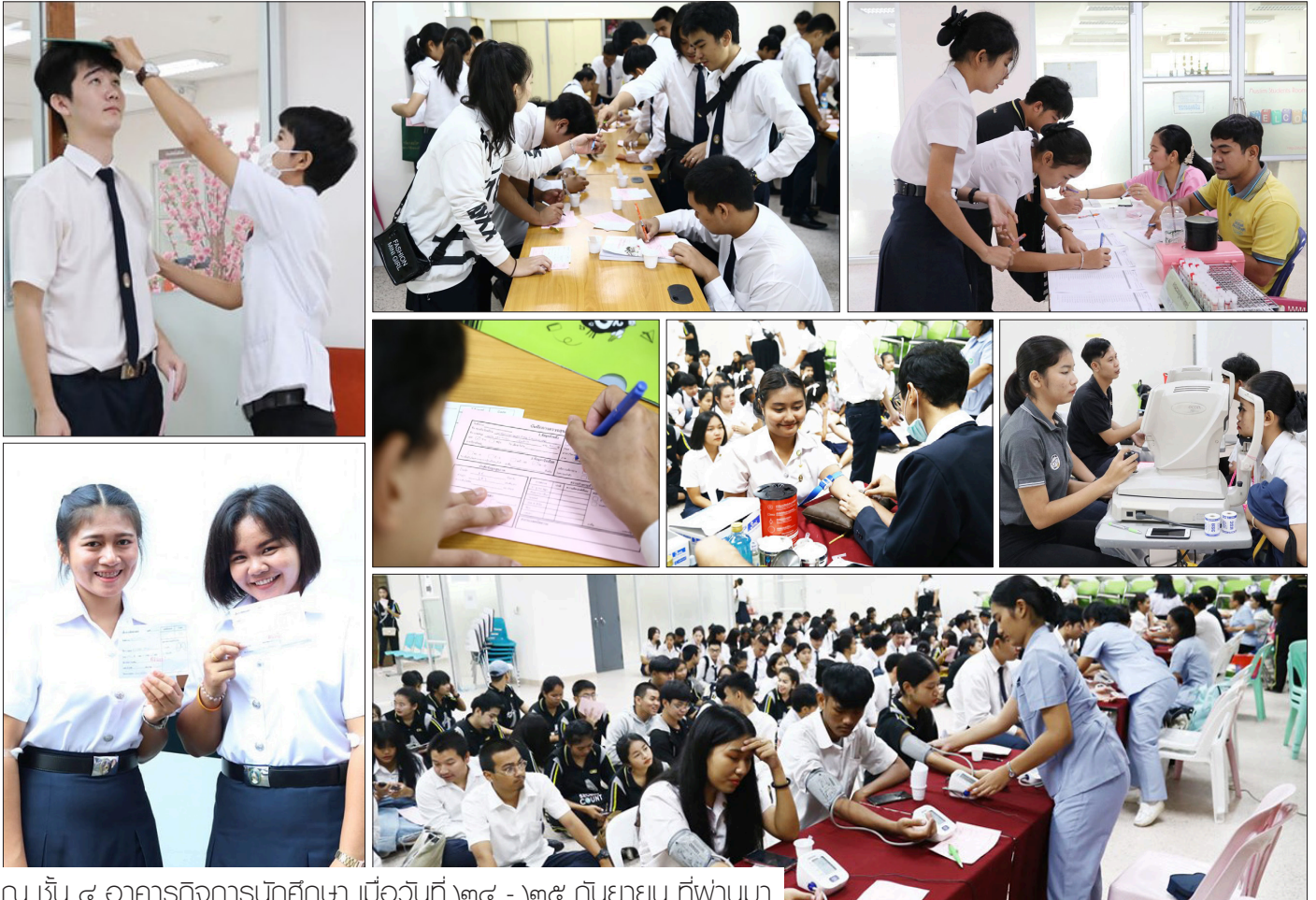
ณ ชั้น ๔ อาคารกิจการนักศึกษา เมื่อวันที่ ๒๔ - ๒๕ กันยายน ที่พานมา

Don't stop when you are tired stop when you are done.