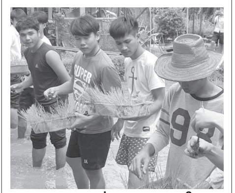
เดินในฉบับ รุ่งพี่เกษตร รับน้องใหม่ ชวนน้องลงแปลงนา ปฏิรูปการรับน้องสร้างสรรค์

นายศุภโชค กล่าวปิดท้ายว่า ภายในงานทุกคนจะได้พบกับสารพัดอาหาร เช่น พิซซ่า โดนัท บะหมี่ ฯลฯ เพียงมีทีมที่พร้อมวิ่ง พร้อมกินพร้อมลุย เพื่อคว้ารางวัลชนะเลิศถึง ๑,๐๐๐ บาท ทั้งหมด ๑๐ ทีม ๆ ละ ๕ คน ซึ่งจะมาสร้างความสนุกสนานให้แก่ผู้เข้าแข่งขันและผู้ชมทุกท่าน