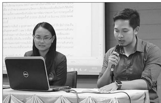
ห้องประชุมจันทรประภัสสร ชั้น ๕ อาคารสำนักงานอธิการบดี เมื่อวันที่ ๔ ตุลาคมที่ผ่านมา