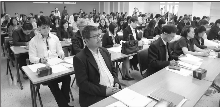
ณ ห้องประชุมจันทรประภัสสร ชั้น ๕ อาคารสำนักงานอธิการบดี เมื่อวันที่ ๕ ตุลาคมที่ผ่านมา