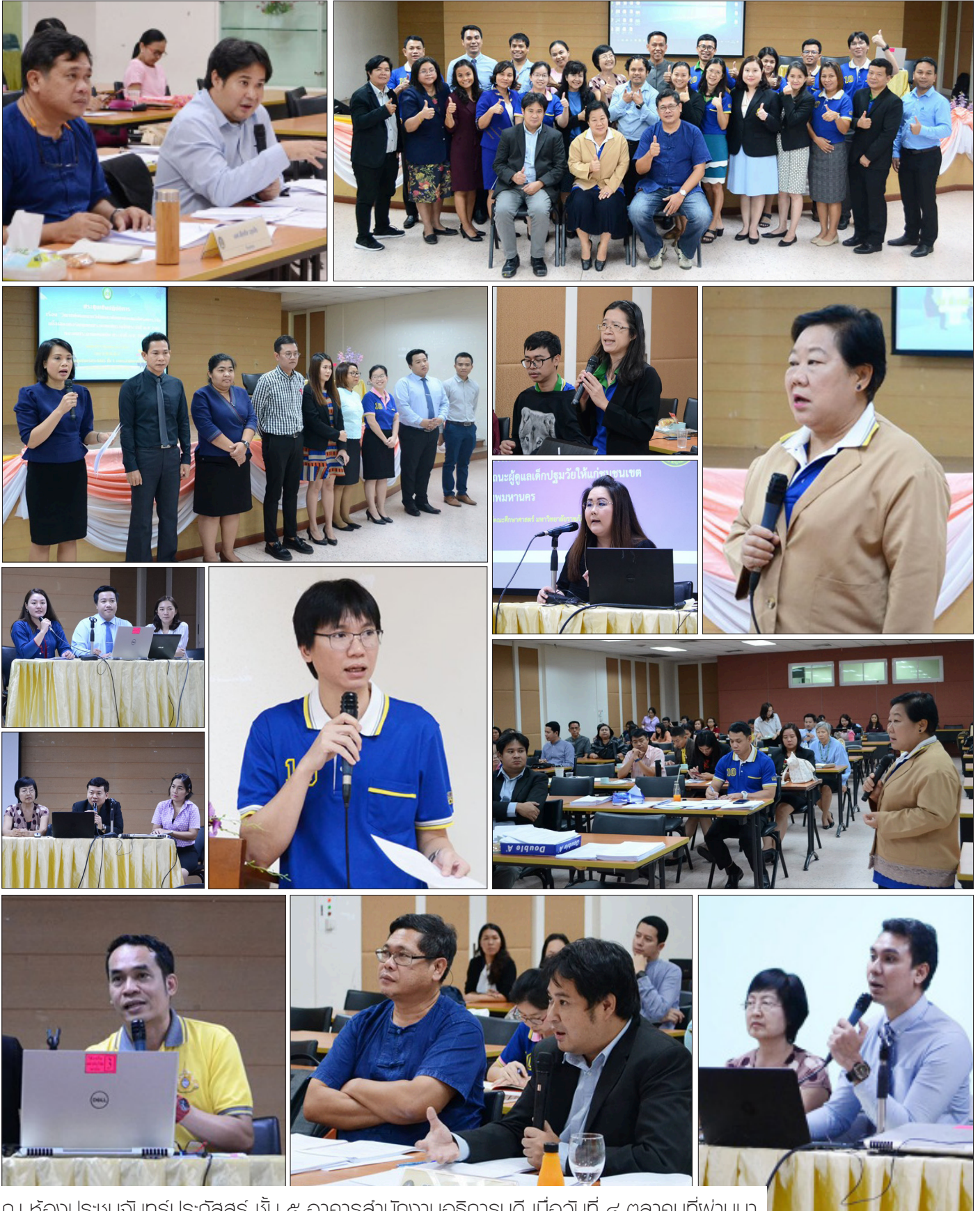
ณ ห้องประชุมจันทร์ประภัสร์ ชั้น ๕ อาคารสำนักงานอธิการบดี เมื่อวันที่ ๔ ตุลาคมที่ผ่านมา