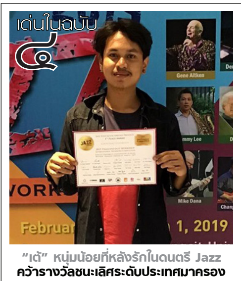
“เด่น” หนุนน้อยที่หลังรักในดนตรี Jazz ควารางวัลชนะเลิศระดับประเทศมาครอง

ผู้อำนวยการฯ กล่าวต่อว่า ด้วยกระบวนการในการจัดสอบก่อนเรียน (pre-test) และสอบหลังเรียน (post-test) รวมทั้งการเข้าเรียนแบบฝึกทักษะภาษาอังกฤษออนไลน์ Speexx ผ่านระบบออนไลน์ด้วยตัวผู้เรียนเองในครั้งนี้หวังเป็นอย่างยิ่งว่า ด้วยกระบวนการนี้ จะเพิ่มทักษะภาษาอังกฤษ ด้านการฟัง การพูด การอ่าน และการเขียน ให้กับบุคลากรสายวิชาการและสายสนับสนุนวิชาการ เพื่อนำไปพัฒนาต่อยอดในการทำงานของตนเองให้สอดคล้องกับการพัฒนามหาวิทยาลัยตามยุทธศาสตร์ของชาติ ในยุคไทยแลนด์ ๔.๐ และสอดคล้องกับนโยบายส่งเสริมและพัฒนาทักษะด้านภาษาอังกฤษให้กับบุคลากรของท่านอธิการบดีต่อไป