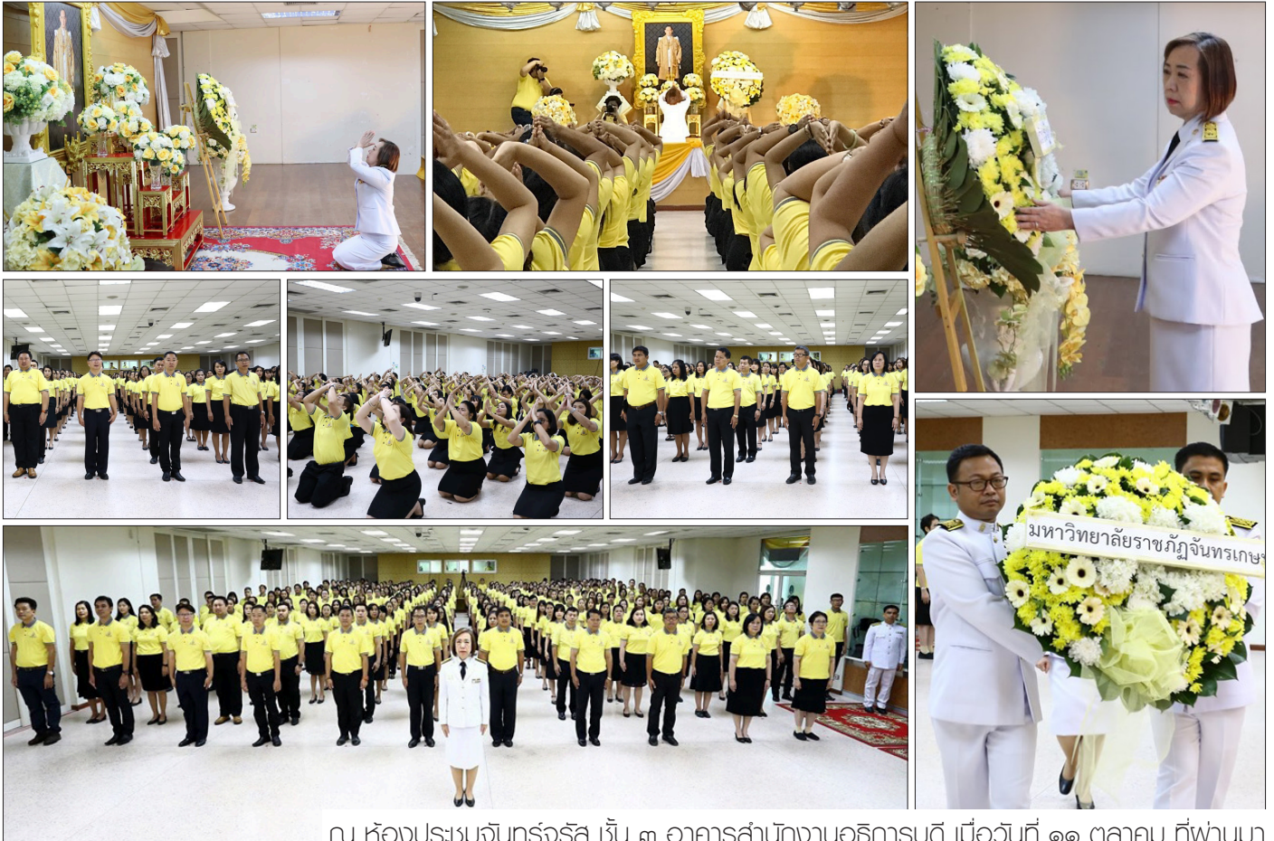
ณ ห้องประชุมจันทรจรัส ชั้น ๓ อาคารสำนักงานอธิการบดี เมื่อวันที่ ๑๑ ตุลาคม ที่ผ่านมา