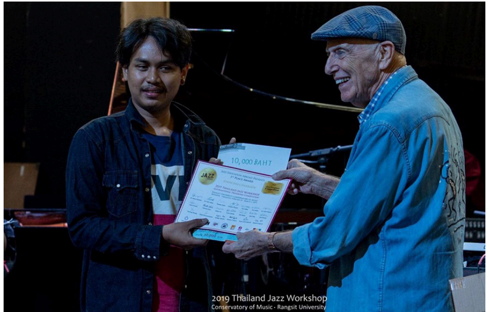
2019 Thailand Jazz Workshop Conservatory of Music - Rangsit University