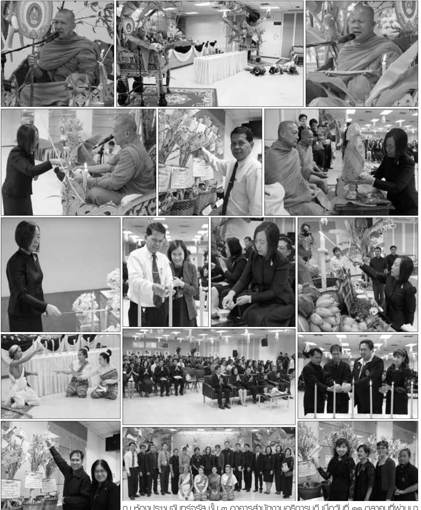
ณ ห้องประชุมจันทร์จรัส ชั้น ๓ อาคารสำนักงานอธิการบดี เมื่อวันที่ ๑๑ ตุลาคมที่ผ่านมา