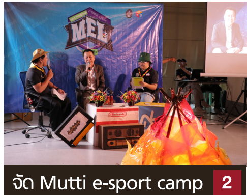
จัด Mutti e-sport camp 2