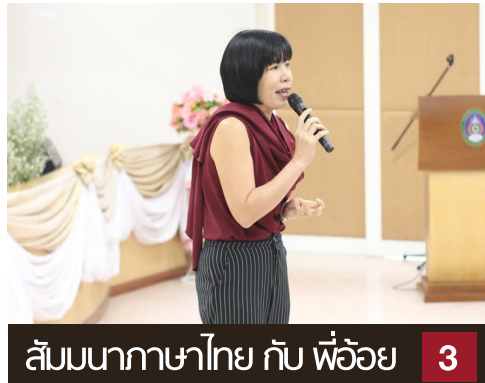
ลับมณฑาภาษาไทย กับ พี่อ้อย 3