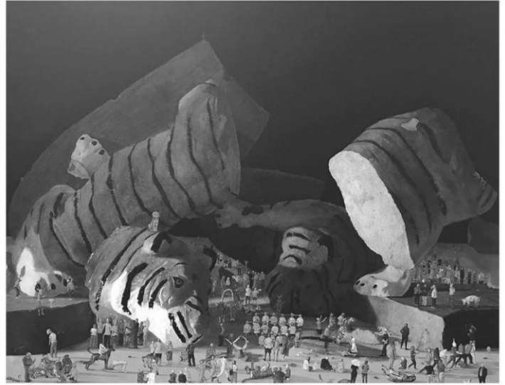
'ไทยงม' ยอดเยี่ยมอันดับ 2 วิพากษ์สังคม