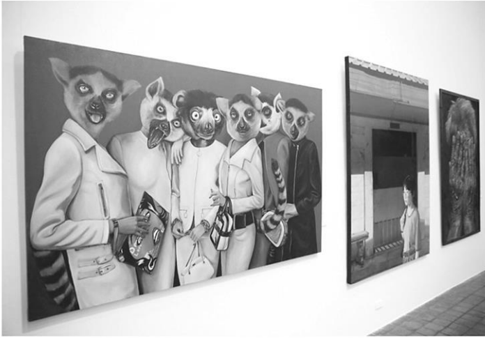
พลาดไม่ได้ นิทรรศการจิตรกรรมร่วมสมัยพานาโซนิค ครั้งที่ 20

ท่าทางต่างกัน เป็นการสร้างพลังแห่งการสะท้อน และเสียดสีสังคมอย่างลุ่มลึก นอกจากนี้ยังมี ผลงานอีกไม่น้อยที่สร้างสรรค์ได้มีคุณภาพและ สามารถดึงอารมณ์ร่วมผู้ชมได้